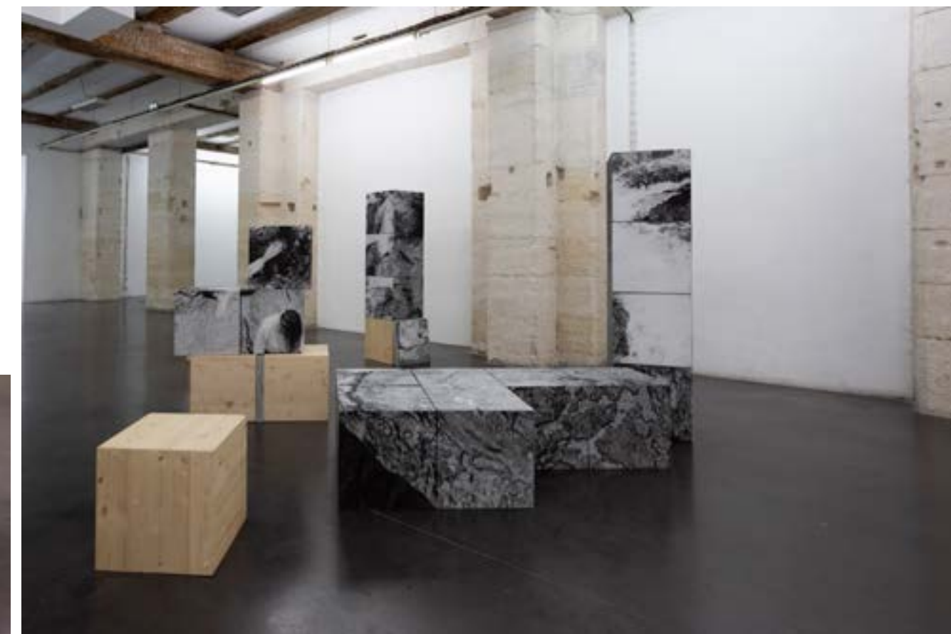
Image Sans Fin, vue d'exposition à la Compagnie Lieu de Création, Marseille, Octobre 2024